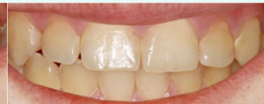
Behandlungsergebnis nach der Kariesinfiltration.